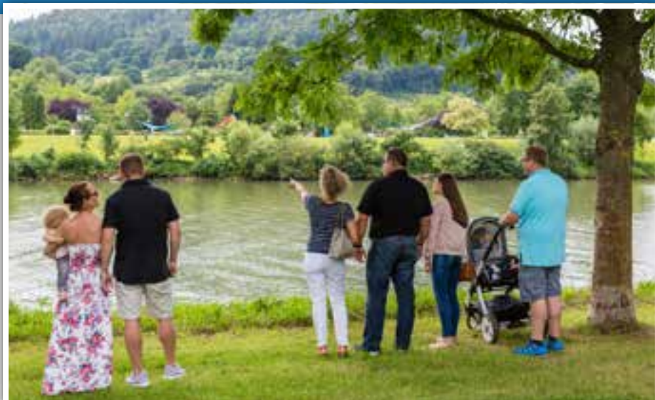
Die Neckarwiese lädt zum Schlendern und Verweilen ein.