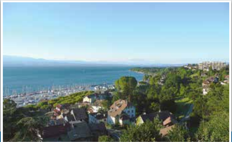
Mit Thonon-Les-Bains am Genfer See verbindet Eberbach eine Städtepartnerschaft.

50-jährigen Jubiläum des Bestehens der Städtepartnerschaft mit Thonon-Les-Bains fanden 2011 von Februar bis Mitte Juli zahlreiche Veranstaltungen, Kurse, Ausstellungen und Aktionen in Eberbach statt.