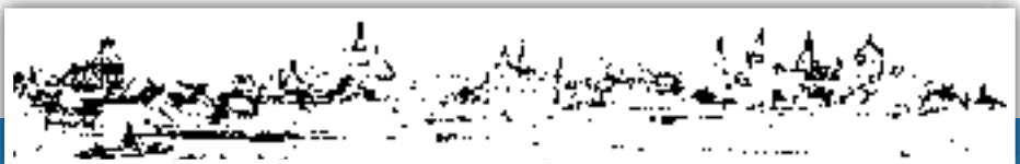
„Älteste Federzeichnung von Eberbach um 1619, Federzeichnung eines unbekannten Niederländers der Frankenthaler Schule, Original im Museum für Bildende Kunst in Budapest.“

Öffnungszeiten: Di. bis Do. 14 bis 16:30 Uhr, So. 14 bis 17 Uhr Außerdem haben Schulklassen, Vereine oder Besuchergruppen die Möglichkeit kostenpflichtig und mit vorheriger Absprache durch einen Führer die Ausstellung zu besichtigen.