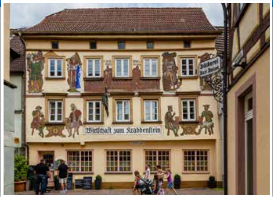
Sgraffiti-Malereien am ältesten Wirtshaus von Eberbach, der "Wirtschaft zum Krabbenstein"