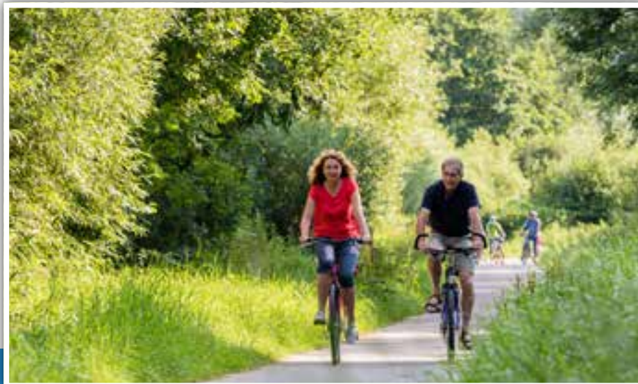
Fahrradtour durch Eberbachs grüne Auen - Bewegung und Erholung.