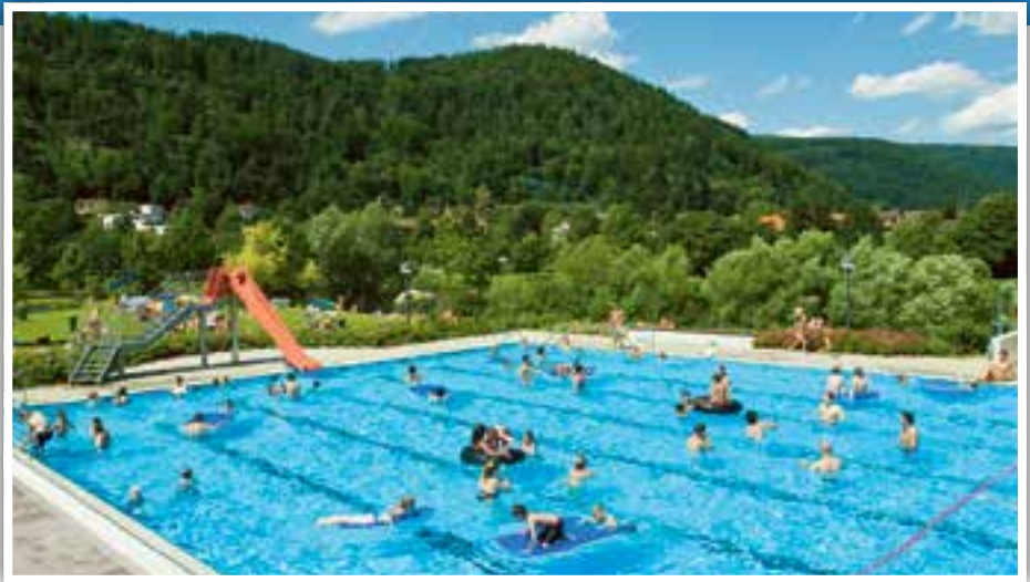
Freibad Eberbach.

Badezentrum in der Au, 69412 Eberbach, Telefon: 06271 7611 und 06271 9209-60 E-Mail: badezentrum@sw-eberbach.de Homepage: www.sw-eberbach.de