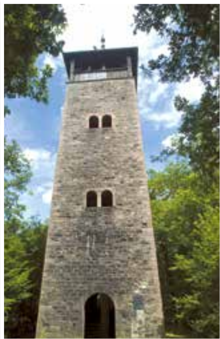
Aussichtsturm auf dem Ohrsbearg in Eberbach.

An der Stelle des Ohrsbeargturms stand damals wahrscheinlich ein hölzerner Turm. Von der 16 m hohen Aussichtsplattform bietet sich den Besuchern ein einmaliger Blick über Eberbach und das Neckartal.