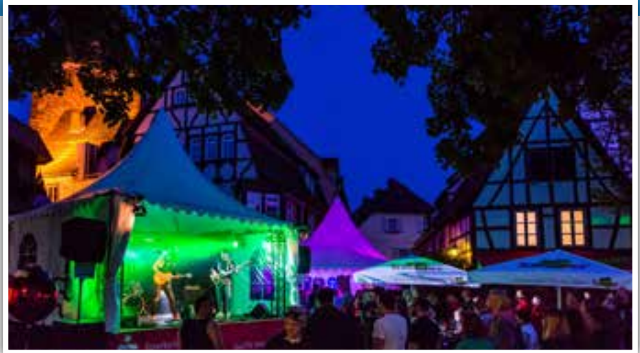
Musikalische Unterhaltung beim Eberbacher Frühling auf dem Lindenplatz