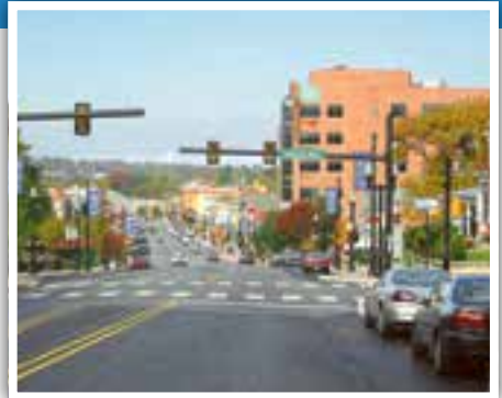
Hauptstraße von Ephrata.

So treffen sich nicht nur die "Offiziellen". Regelmäßig finden auch Jugend- und Schüleraustausche statt. Hierzu wurde extra die "Stiftung Jugendaustausch", ins Leben gerufen, so dass diese Austausche auch finanziell unterstützt werden können. Zum