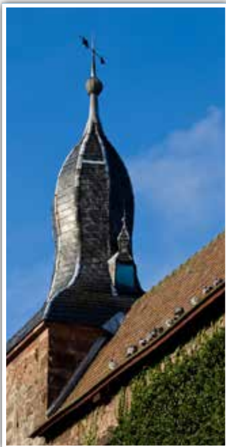
Blauer Hut.

Der niedere Eckturm ist der kleinste, jüngste und eleganteste der vier Stadttürme. Er stammt aus dem 14. Jahrhundert und hat seinen Namen von der mit blauschwarzem Schiefer gedeckten Dachhaube. Im Stockwerk darunter lag die "Betzenkammer", das städtische Arrestlokal, in der so mancher Zeitgenosse seine Strafe absaß.