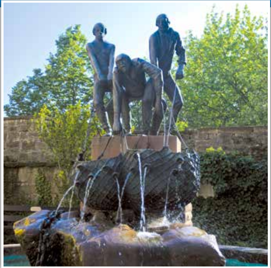
Fischerbrunnen im Innenhof des Pulverturms, Eberbach.

VHS Eberbach-Neckargemünd 06271/946210, www.vhs-eb-ng.de