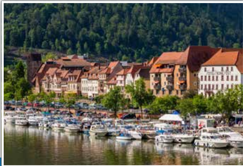
Sternfahrt Südwest des Deutschen Motoryachtverbandes im Juni 2016.

Durch die Stadt Eberbach wurde eine attraktive Möglichkeit geschaffen, damit Sport- und Kajütbooten am Rande der historischen Altstadt vor Anker gehen können. Nur ein Steinwurf entfernt von Restaurants, Einkaufsmöglichkeiten und Sehenswürdigkeiten lädt der Anlegeplatz am Eberbacher Neckarlauer zum Schlemmen, Shoppen und Schlendern ein.