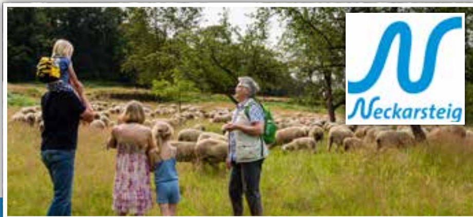
Schafe auf dem Breitenstein, unterhalb der Ernst-Hohn-Hütte.

Neckarsteinach. Von dort führt der Weg nach Hirschhorn (15 Kilometer). Das zwölf Kilometer entfernte Eberbach ist die Endstation der dritten Etappe, Von Eberbach steigt er hoch hinauf auf den Breitenstein und begleitet dort ein Stückweit den Themenweg „Eberbacher Pfad der Flussgeschichte“. Neunkirchen erreicht der Wanderer am Abend des vierten Tages nach rund 18 Kilometern. Über Neckarkatzenbach geht es nach Neckargerach (17 Kilometer). Auf dem „Margarethenschlucht-Pfad“ wird nach Diedesheim und dann nach Mosbach gewandert, das nach rund 14 Kilometern Wegstrecke erreicht wird. Von dort geht es über Haßmersheim nach Gundelsheim (14 Kilometer) und die letzte Etappe schließlich endet nach und zwölf Kilometern in Bad Wimpfen. Alle acht Etappen erstrecken sich über 126,4 Kilometer. 3127 Höhenmeter sind zu bewältigen, wobei die ersten vier Etappen diesbezüglich etwas anspruchsvoller sind als die letzten vier Touren. Dank des Wegeleitsystems ist die Route praktisch „unverlaufbar“, an allen Zielorten gibt es S-Bahn-Anschluss beziehungsweise Bahnstationen. Infos: www.neckarsteig.de