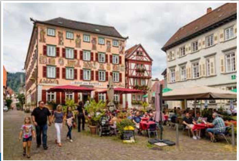
Das historische Hotel zum Karpfen und weitere Gastronomiebetriebe am Alten Markt.