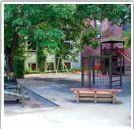
Kindertagesstätte St. Elisabeth.

Öffnungszeiten: 7:15 bis 8:45 Uhr und 12:05 bis 13:05 Uhr