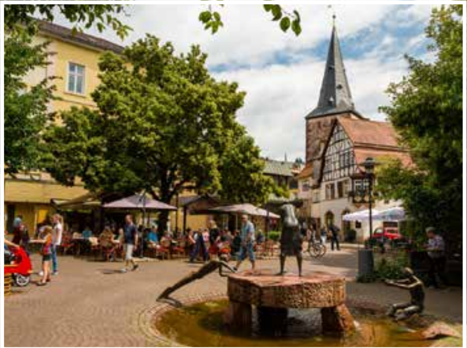
Lindenplatz mit Haspelturm hinter dem Spohr'schen Haus.

Relikt aus der Zeit, als Badezuber, Wasserdampf und Rauch das Bild hier beherrschten, ist der ehemalige Feuerraum in der Mitte des Gewölbes. Heute befindet sich in dem Gebäude ein Hotel.