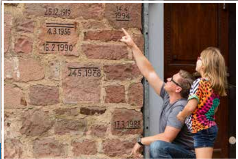
Beeindruckend, die Hochwassermarken in der Altstadt.

Kolpingfamilie Eberbach, Wolfgang Hilbert, Steingartenweg 14, 69412 Eberbach