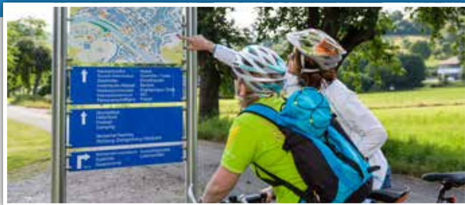
Ob gemütlich oder sportlich, Radfahren rund um Eberbach

schaukel, Wippe, Kleinkindwippe, ein Fußballtor auf abgetrenntem Gelände. Alter: Für kleine und große Kinder