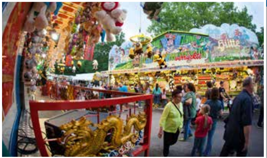
Der Eberbacher Kuckucksmarkt, das große Volksfest Ende August.