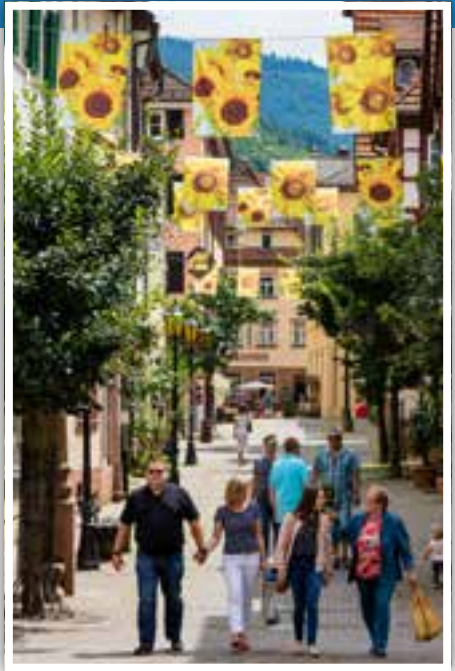
Kellereistraße. Die Verbindungsstraße zwischen Leopoldplatz und Alter Markt

Museum im historischen Rathaus am Alten Markt. Die geschichtliche Entwicklung der 1227 gegründeten Stauferstadt ist eng verbunden mit der sie umgebenden Natur. Diese natürlichen Gegebenheiten - Lage in einem tief eingeschnittenen Flusstal, umgeben von ausgedehnten Wäldern und eingebettet in das Buntsandsteingebirge des Odenwaldes - waren über Jahrhunderte hinweg die Lebensgrundlage der Bewohner Eberbachs. Besondere Schwerpunkte des