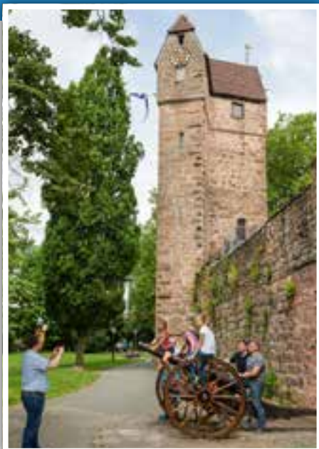
Der Pulverturm - einer der vier Stadttürme, Wahrzeichen von Eberbach.

Der schlanke Pulverturm stammt aus dem 14. Jahrhundert und ist Teil der historischen Stadtbefestigung. Er wird auch Mantelturm genannt, da er ursprünglich als Mantel um die südwestliche Ecke der Stadtmauer gebaut wurde. Im obersten Geschoss befindet sich eine handgeschmiedete Turmuhr vom bekannten Uhrmacher Franz Jakob Braun, die im Sommer zu besichtigen ist. Wer den Neckar einmal von der Eberbacher Stadtmauer aus sehen will, der kann den Turm problemlos erklimmen. Eine alte französische Kanone aus dem Jahre 1878, die unter dem Turm steht, rundet das Bild der Vergangenheit ab.