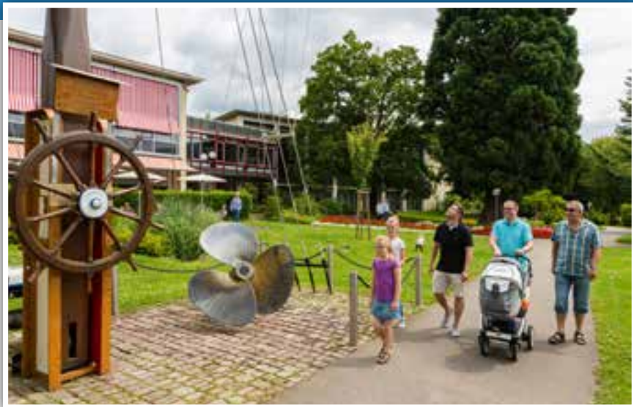
Neckaranlage mit Stadthalle, Restaurant und Schiffermast