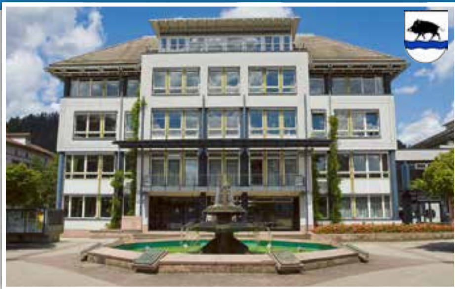
Das Rathaus mit Wappenbrunnen auf dem Leopoldsplatz.

Ortsteile: Neben der Kernstadt gibt es noch weitere Ortsteile, die zu der Stadt gehören.